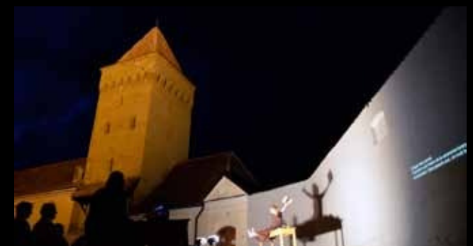
„Hexen, Heiden, Heilige“ Freilichtvorstellung in Medias / Rumänien

Eine Lichtenanlage kann vom theater am barg gestellt werden.