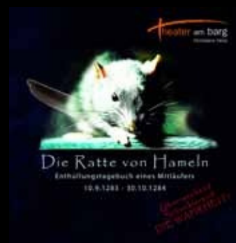
„Die Ratte von Hameln – Enthüllungstagebuch eines Mitläufers“ (theater am barg 2013)