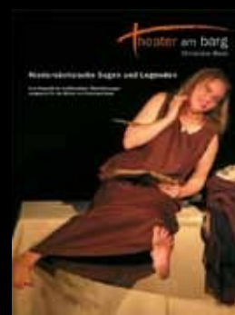
„Das Schnürgretchen“ Eine Auswahl Niedersachsens skurrilster und schillerndster Sagen und Legenden (theater am barg 2013)